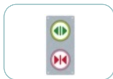
エレベータ ボタン